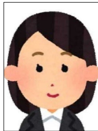
上三分身 より大きい