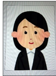
免許証等の 写真の写真