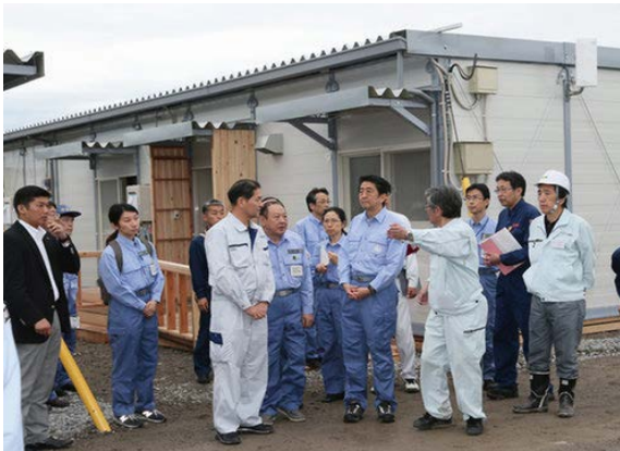
安倍内閣総理大臣視察