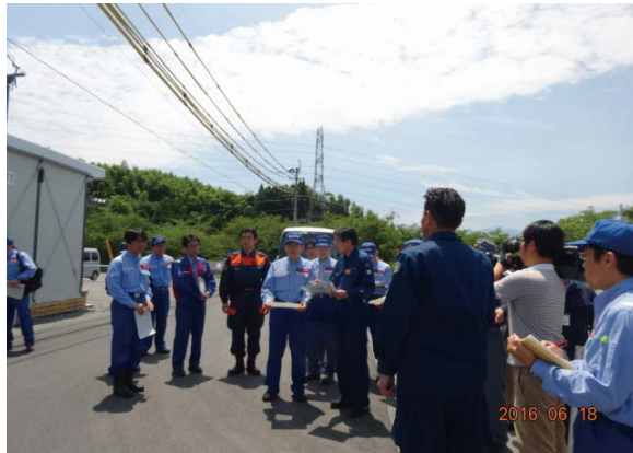
石井国土交通大臣視察